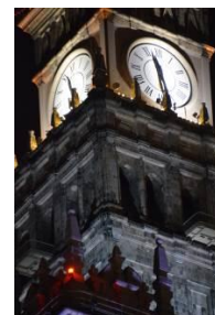
Warschau City, Zentrum