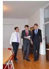
Dr. Kalliwoda Research in FIM