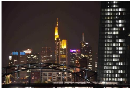
Skyline Frankfurt am Main