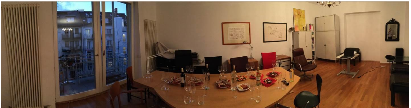
Capital Evening in unserem Büro im Westend in Frankfurt am Main