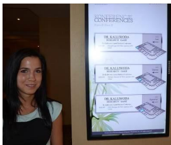
Unsere Konferenz in Warschau/Teammitglied