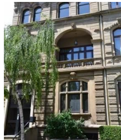
Dr. Kalliwoda Research, Frankf.-Büro