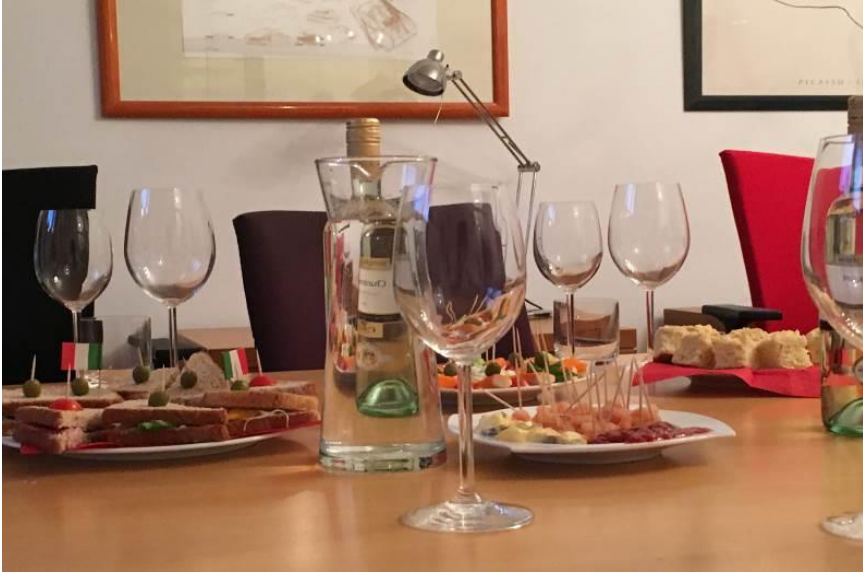
Vor dem Eintreffen der Gäste