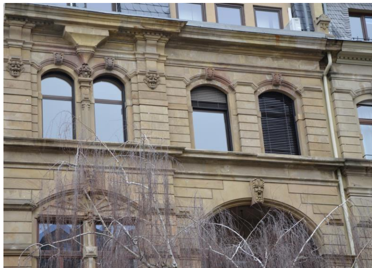
Dr. Kalliwoda Capital Evenings in unserem Büro Frankfurt/Westend